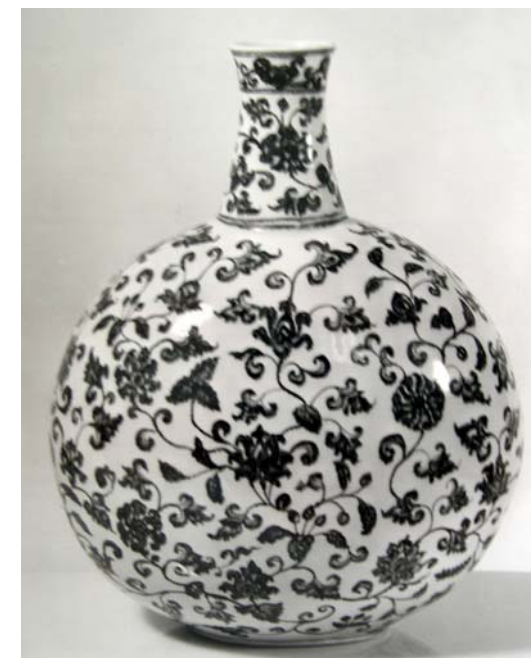
Kinesisk pilgrimsvase i porcelæn, første halvdel af 1500-tallet, Kunstindustrimuseet.